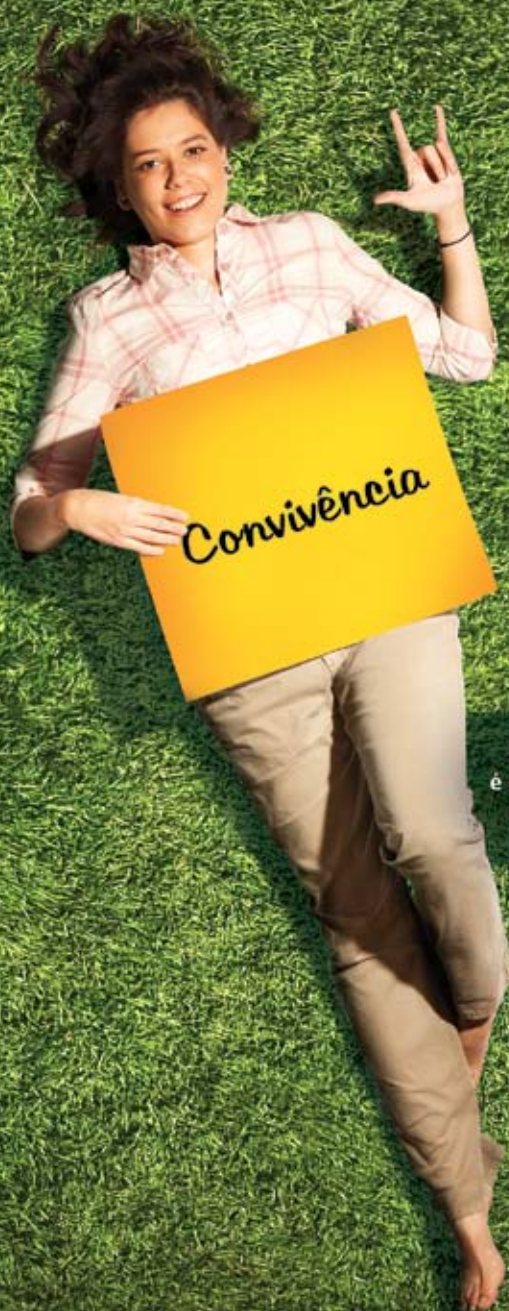
Helenne Sanderson é estudante de design gráfico e tem deficiência auditiva