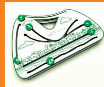
Jogo de Atenção Conjunta Joint Attention Game