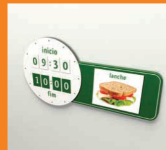
Relógio de parede Wall clock