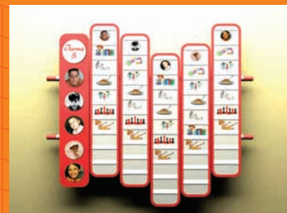
Quadro de Atividades Diárias Table of Daily Activities