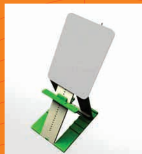
Prancheta Tipo Cavalete Easel-type Clipboard

Development of pedagogical objects to support the teaching and learning process of the autistic child