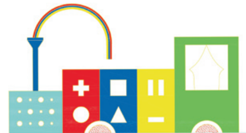
Figura 11: Elevação lateral da Maria-Fumaça.

WERNER, David. Guia de deficiências e reabilitação simplificada . Brasília: CORDE, 1994.