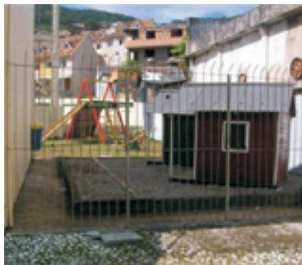
Figura 5: Vista do parque infantil, nota-se que a área não recebe insolação adequada, o piso é irregular (brita) e o degrau dificulta o acesso de deficientes, principalmente os cadeirantes.