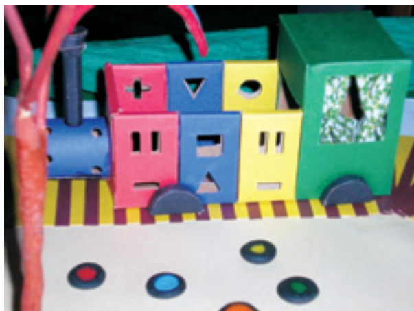
Figura 10: Maquete da Maria-Fumaça, primeiro brinquedo do circuito temático. A escala utilizada foi 1:25.