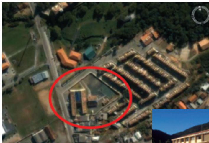
Figura 1: Vista aérea do terreno da escola.

Localizada no bairro do Saco Grande, numa área residencial distante cerca de oito quilômetros do centro de Florianópolis, Santa Catarina, essa escola é considerada modelo, por ser um projeto padrão desenvolvido pela Prefeitura Municipal e por seguir a NBR 9050/97. A edificação foi construída em 2001, num terreno plano e possui num único bloco de dois pavimentos, todas as salas de aula e funções administrativas (Figuras 1 e 2). Há