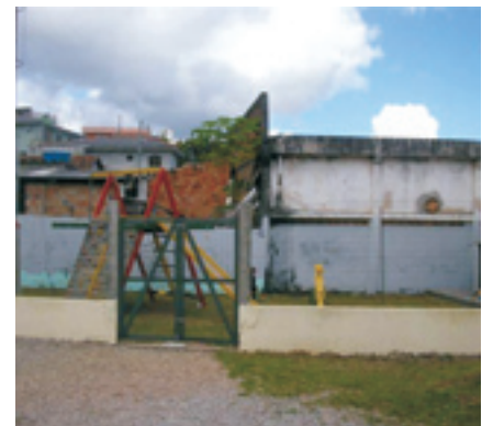
Figura 6: Vista do parque infantil, nota-se o portão e a cerca (tipo galinheiro), os brinquedos padronizados e o piso (grama) que dificulta o acesso de cadeirantes.