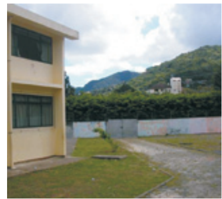
Figura 4: Vista do pátio externo, nota-se que não há equipamentos para as acomodações dos alunos nos intervalos de aula e nas atividades de Educação Física. O piso (brita) e a ausência de passeios dificultam o acesso de cadeirantes e a ausência de referenciais fixos prejudica o trajeto seguro dos deficientes visuais.

O piso em brita e a ausência de equipamentos e vegetação tornam o pátio externo inóspito, limitando as atividades e o acesso dos alunos durante o intervalo e nas aulas de Educação Física. Além disso, esse espaço é reduzido, não é acessível e está em péssimas condições de uso (Figuras 5 e 6).