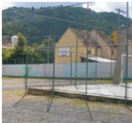
Figura 3: Vista da quadra de esportes, nota-se ausência de tratamento paisagístico, mobiliário e de piso regular.

quados às atividades que desempenham, com boas dimensões, qualidade nos acabamentos, nos acessos e nas circulações. Entretanto, a área externa apresenta muitos pontos negativos, principalmente em relação à acessibilidade espacial e à ausência de tratamento arquitetônico e paisagístico (Figuras 3 e 4).