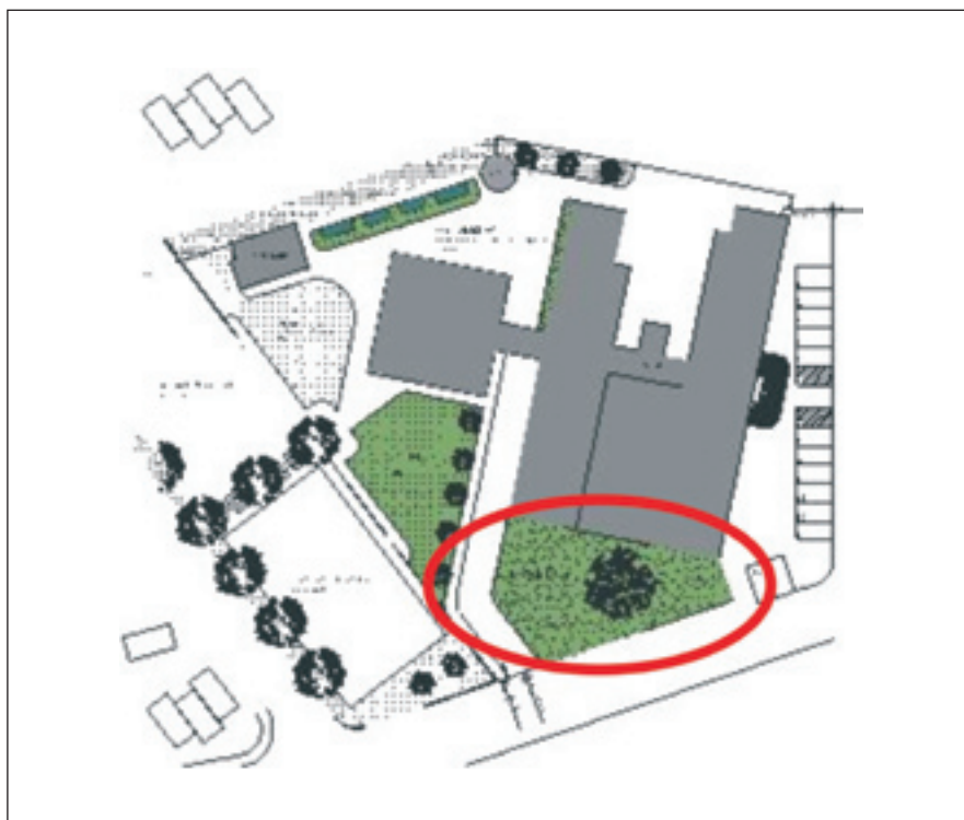
Figura 8: Planta-baixa da implantação proposta, com destaque para a área destinada ao novo parque infantil.