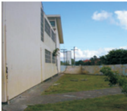
Figura 7: Vista do local de implantação do novo parque infantil.

Assim, buscou-se criar um parque infantil livre de barreiras físicas, permitindo que todos os usuários, independente do tipo de deficiência ou restrição, pudessem compreendê-lo, deslocarem-se e, principalmente, brincarem com autonomia, segurança e igualdade de condições.